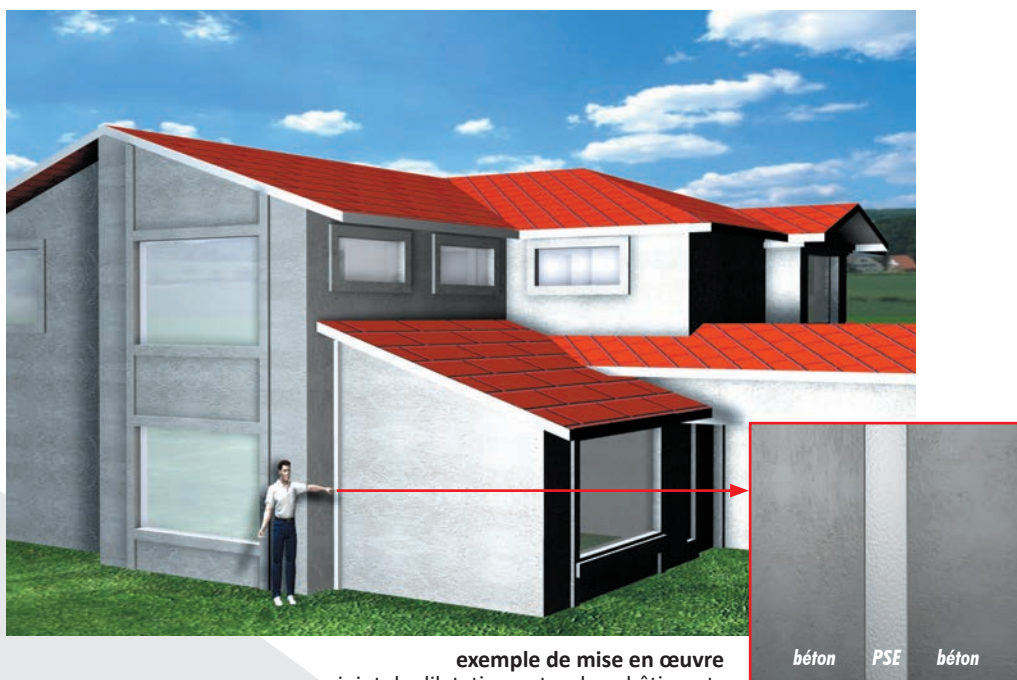
exemple de mise en œuvre joint de dilatation entre deux bâtiments

La mise en œuvre du panneau DELTIBAT répond simplement à l'application choisie. Il n'existe pas de normes ni de cahiers techniques à ce jour décrivant une procédure particulière d'utilisation.