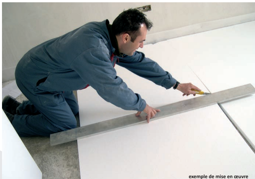
exemple de mise en œuvre

La mise en œuvre des panneaux DELTIDAL Th se réalise selon les DTU 52-1 (revêtement de sol scellé) ou DTU 26-2 (revêtement de sol collé).