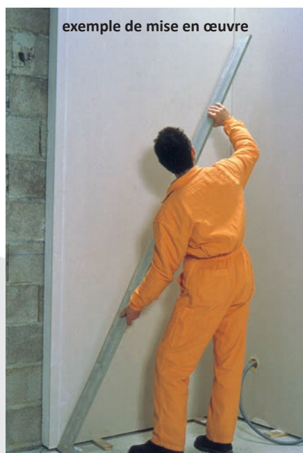
exemple de mise en œuvre

Les travaux préparatoires et la mise en œuvre du DELTIPLAC Th38 se réalisent selon les DTU 25-42. La pose est en général effectuée par collage sur un support sain, sec, dépoussiéré et exempt de tout produit gras, peinture ou enduit plâtre. On utilisera un mortier adhésif à base de plâtre répondant aux spécifications de la norme NF. Le traitement des joints entre les plaques sera réalisé au moyen d'un des systèmes enduit associé à une bande faisant l'objet de certificats CSTB attachés aux Avis Techniques correspondants. Avant application de la peinture, le régulateur de fond uniformise la teinte des plaques.